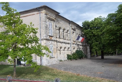
Bâtiment de l'école

Dans la partie basse du village, le bâtiment de l'école (18) qui a été construit en 1843, abritait à l'époque l'école de garçons, la mairie et un prétoire de justice de paix.