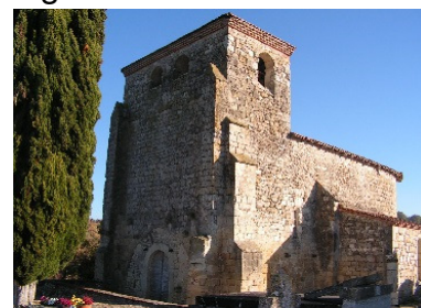
Église de Floirac

De ce lieu (19), des départs de circuits de randonnées pour découvrir le reste du patrimoine, richement doté de plusieurs églises : l'Église de Saint-Médard et son clocher du XIIIe siècle, l'Église Saint-Vincent de Pérignac du XIXe siècle, les ruines de l'Abbaye Cistercienne de Notre-Dame de Pérignac du XIIe siècle, l'Église de Floirac du XV- XVIe siècle, l'Église de Saint-Martin de Pagnagues du XIIIe siècle, l'Église de Saint-André du XIXe siècle et l'Église de Saint-Jean de Balermes du XIIe siècle. Fontaine et lavoirs du Touron du XIXe siècle, Fontaine et lavoir de Saint-Médard du XIXe siècle ainsi que 10 calvaires, 1 oratoire et un moulin à vent en ruine (Saint-Médard).