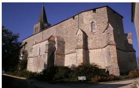
Notre-Dame de Montpezat

En continuant ce chemin de ronde vous allez pouvoir admirer l'Église « Notre-Dame de Montpezat » (11) construite au XV e siècle.