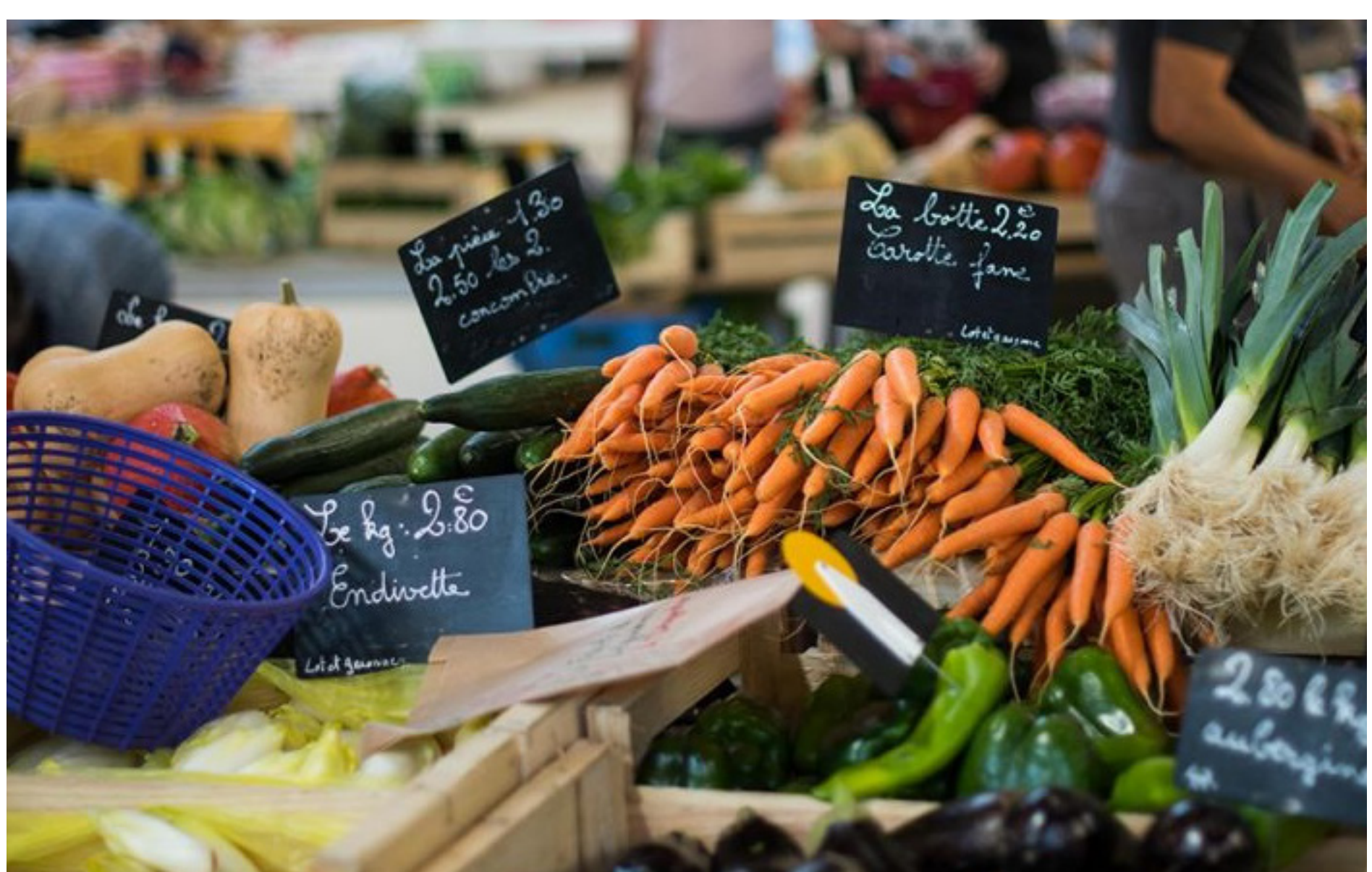
Halle de Prayssas