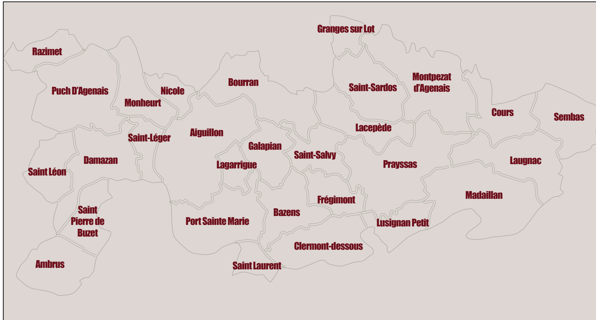
CC DU CONFLUENT ET DES COTEAUX DE PRAYSSAS