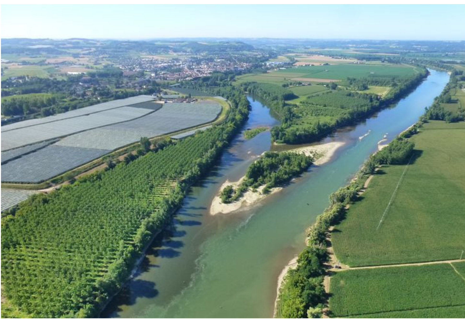
Le confluent de la Garonne et du Lot