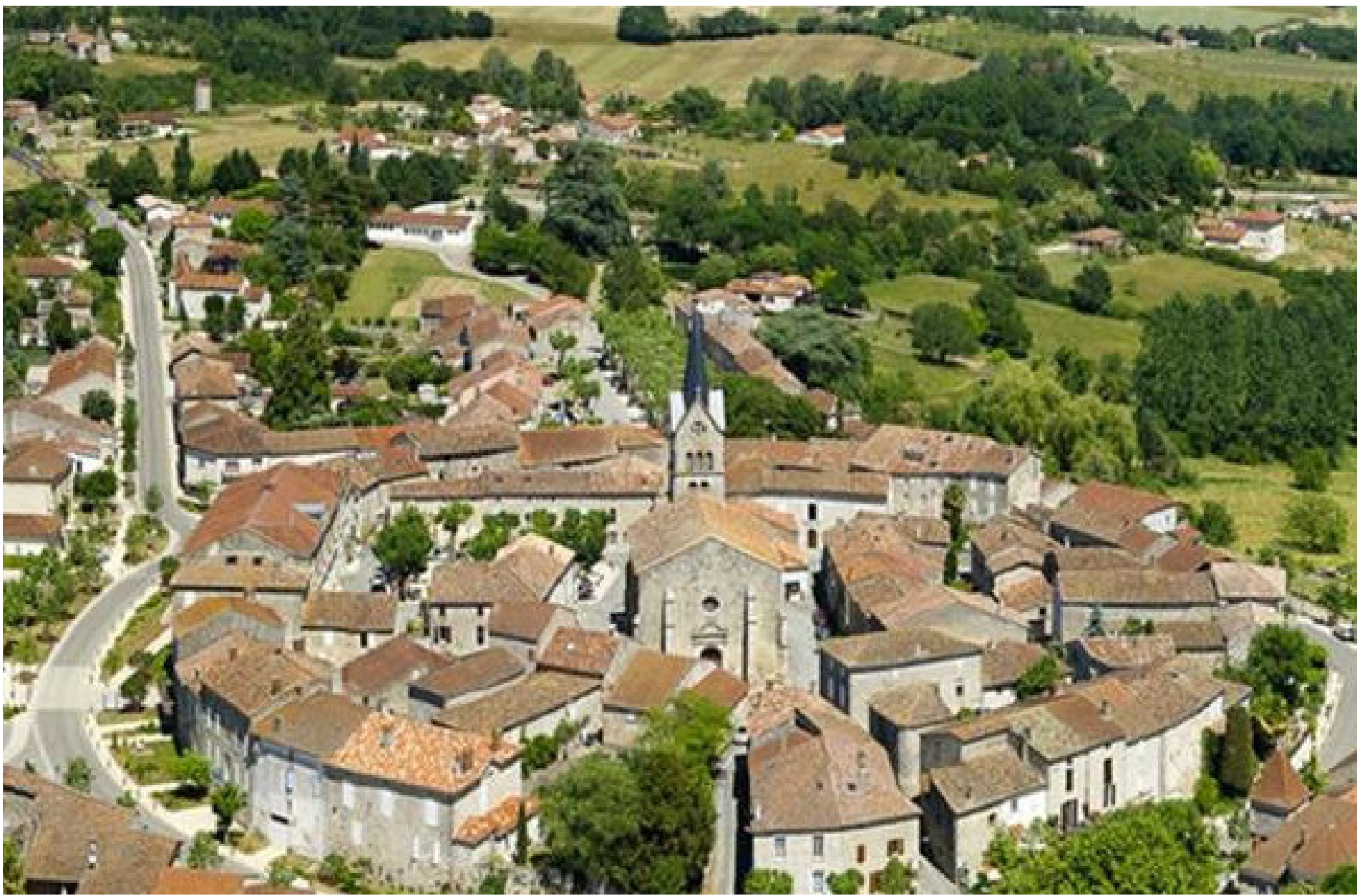
Le Village de Prayssas